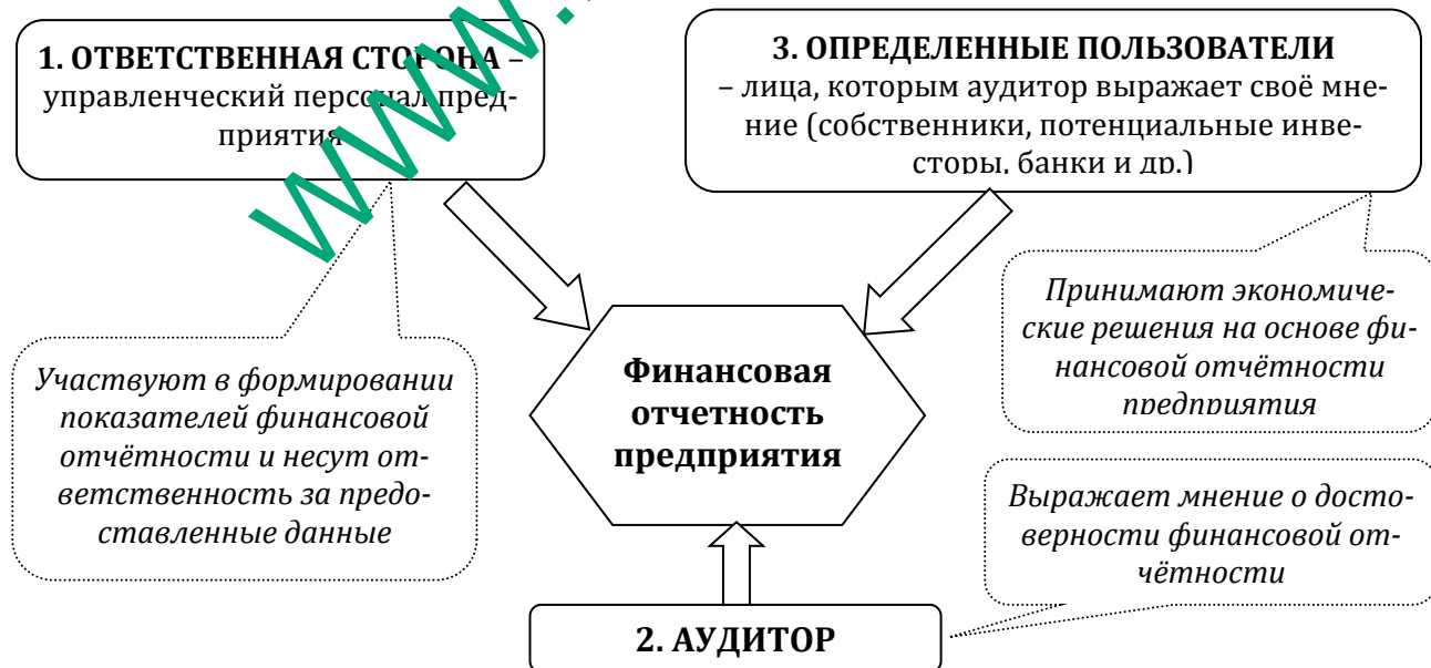
Рис. 1.1. Трёхсторонние отношения в аудите

Основная идея аудита заключается в существовании трехсторонних отношений между ответственными за предоставление информации, определенными пользователями и независимым аудитором, который высказывает свое мнение относительно качества этой информации (рис.1.1.).